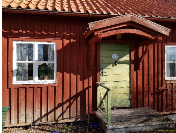
Figur 33. Grön kulör dörr och räcke.