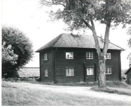
Figur 23. Trädgårdsmästarbostaden 1926 med entré från väster.