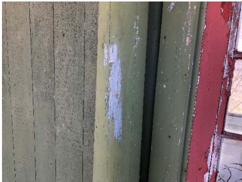
Figur 68. Pelarna har en underliggande blågrå kulör, som möjligen härrör från ett äldre utförande innan flytten till Hallunda.