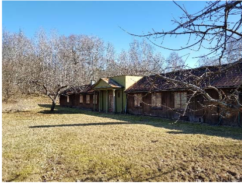
Figur 66. Orangeriet sett från nordväst.

Dokumenterade äldre kulörer: På pelarna finns en äldre kulör; S5502-G/S5500-N. Eftersom denna inte återkommer på det gröna väggpartiet hålls det för sannolikt att denna gråa ton hör samman med skedet innan flytten till Hallunda