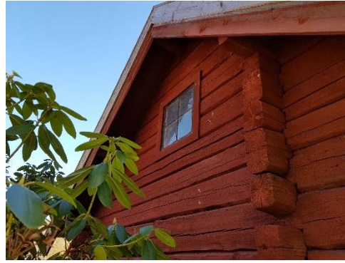
Figur 32. Fönster med röd omfattning norra gaveln.