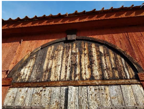
Figur 40. Tjärade dörrar och överstycken.