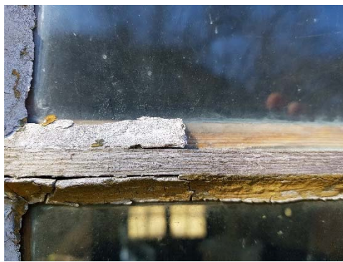
Figur 58. Fönster, spår av ockragul på kitt.