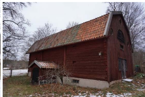
Figur 36. Magasinet sett från sydöst.