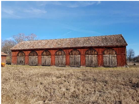
Figur 39. Vagnslider sett från väster.