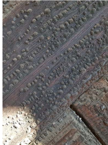
Figur 79. Tjocka lager äldre tjära på nedre dörr i väster.