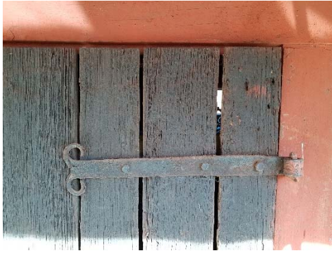
Figur 31. Tjärade dörrar och beslag.