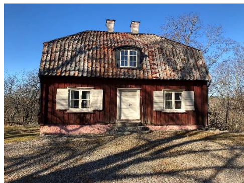
Figur 13. Västra flygeln 1922.