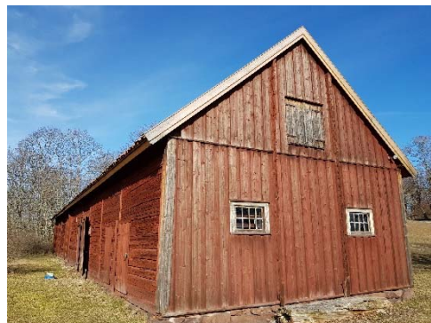
Figur 48. Ladugården sedd från sydväst.