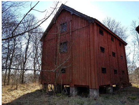
Figur 76. Magasin från nordöst.