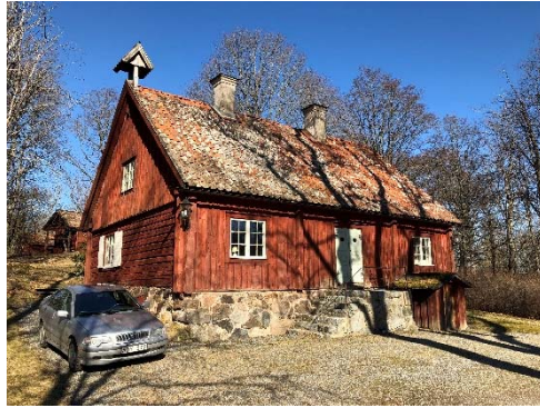
Figur 62. Klockhuset sett från sydväst.