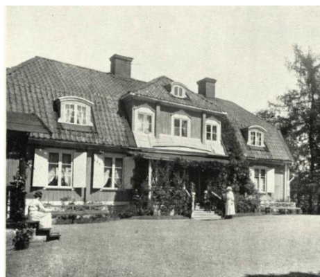
Figur 3. Hallunda gård avbildad 1901. Man kan ana huvudbyggnadens mörkare fönsterbågar samt något av verandans utformning.