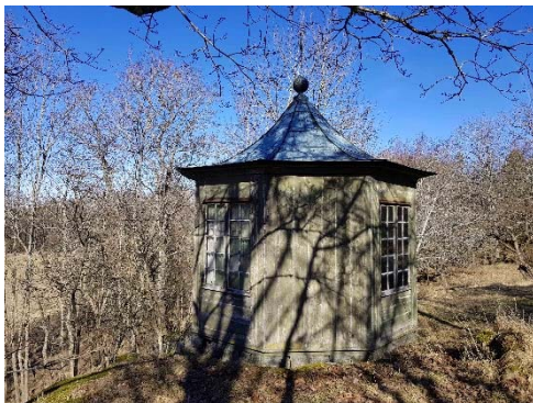
Figur 54. Lusthuset sett från sydväst.