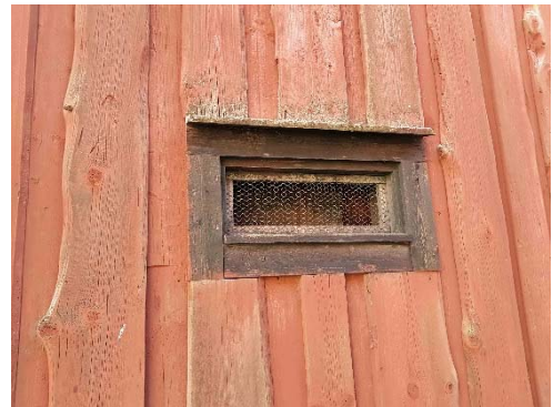
Figur 77. Tjärad omfattning kring öppningar.