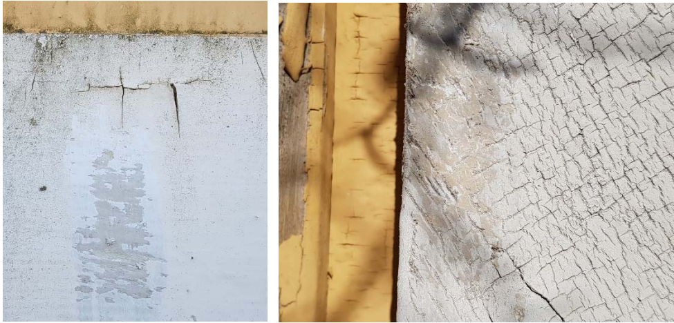
Figur 7. Skrapat parti på sockellist. Underliggande beige kulör S3005-Y20R.