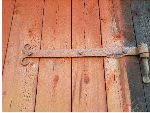
Figur 41. Enkeldörr med falurödfärg.