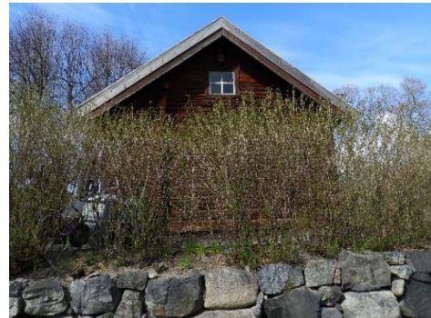
Figur 30. Fönster med vita spröjs och röd omfattning södra gaveln.