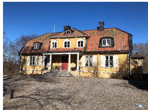
Figur 6. Norra sida, observera att färgen bakom fönsterluckan är mindre blekt.