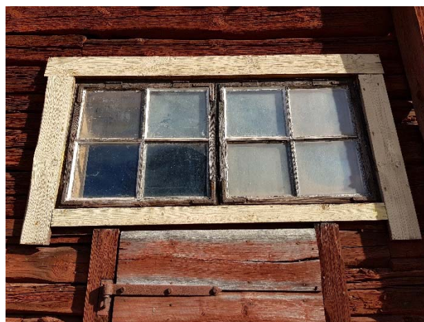
Figur 52. Vit fönsteromfattning med svart bäge.