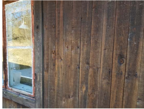
Figur 67. Fasadpanelen har en brunaktig kulör, men inga pigmentspår.