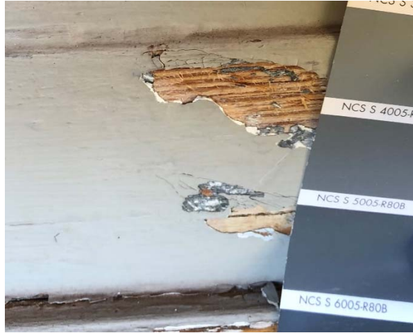
Figur 28. Äldre färgfragment på östsidans dörr S5005-R80B.