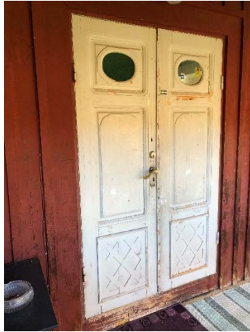
Figur 27. Dörr på östsidan.