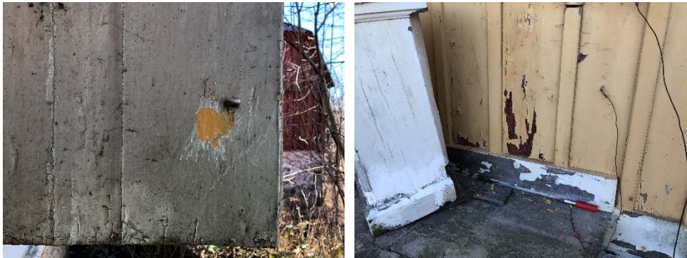
Figur 9. Skrapat parti på baksidan av fönsterlucka visar äldre gul kulör.