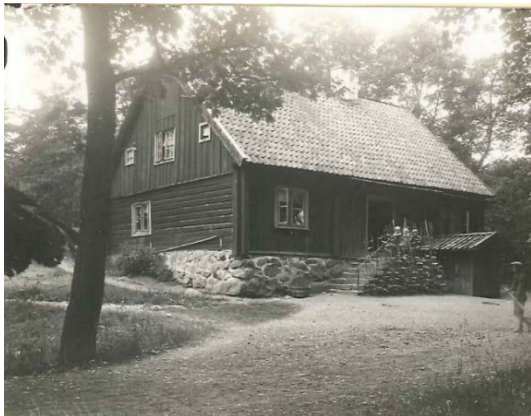
Figur 60. Klockhuset 1926 med annan typ av fönster.

Dokumenterade äldre kulörer: S4005-G50Y.