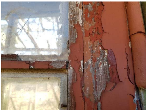
Figur 70. Fragment av äldre brunrött pigment på dörr.