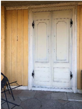
Figur 11. Dörr mot veranda i norr.