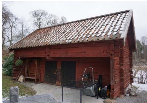
Figur 29. Loftboden sedd från sydväst 2016.