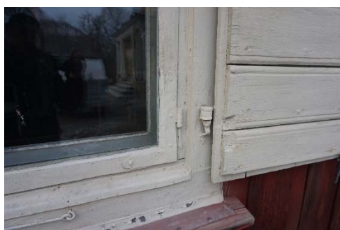
Figur 15. Ljusgrått fönster och fönsterlucka.