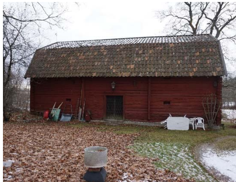
Figur 35. Magasinet sett från norr.