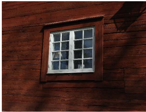
Figur 25. Trädgårdsmästarbostaden sedd från sydväst.