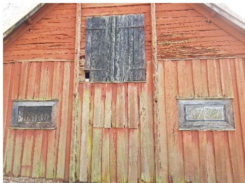
Figur 47. Ladugården sedd från norr.

Nuvarande kulör: Tjärade Dokumenterade äldre kulörer: