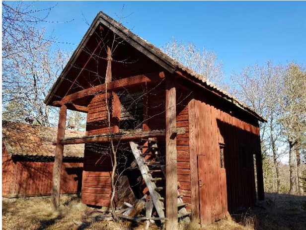
Figur 78. Bod från sydväst.