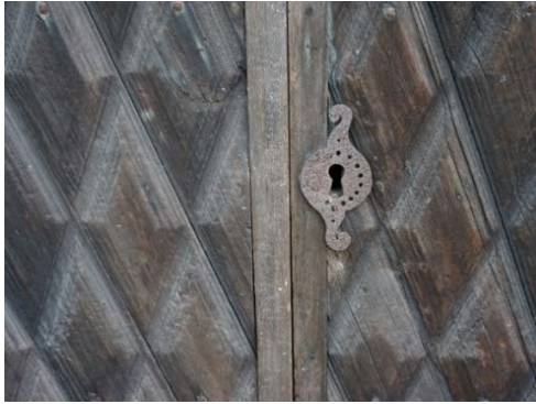
Figur 37. Detalj av tjärad port på norra långsidan.