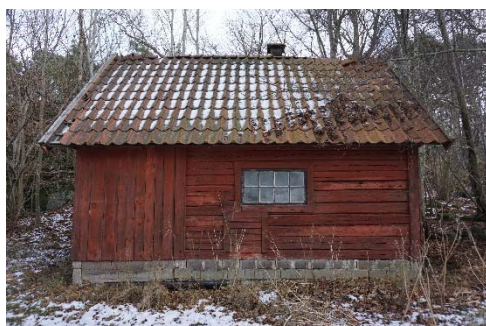
Figur 72. Svinhus mm.