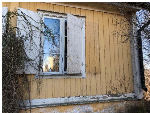
Figur 5. Corps de logis med dagens färgsättning.

Dokumenterade äldre kulörer: Inga äldre kulörer på pelare. Locklisten har en röd kulör under nuvarande gula kulör, motsvarande S6020-Y80R. Möjligen kan denna röda kulör höra samman med den tidigare verandan då den inte återfinns på fasaden i övrigt. Den röda kulören bör därför inte användas vid ommålning.