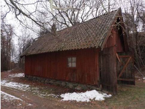
Figur 73. Garage med röda fönsteromfattningar och portar.