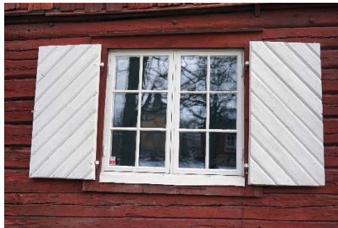
Figur 64. Fönster med röd omfattning och ljusa fönsterluckor.