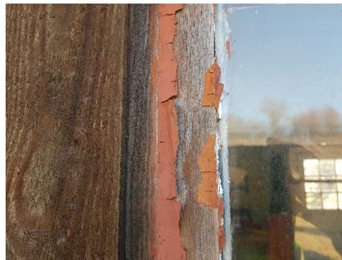
Figur 71. Fragment av äldre brunrött pigment på fönsterbågens högra del.