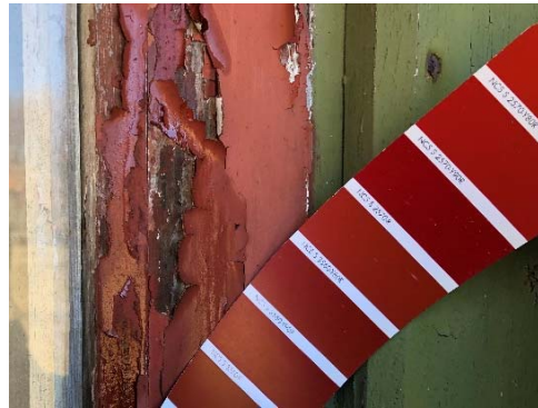
Figur 69. Nuvarande röda kulör på dörr och fönsterbågar.