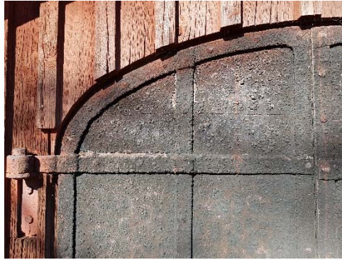
Figur 38. Spår av tjära på port på södra sidan.