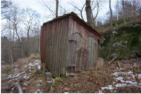
Figur 53. Dasset 2016.