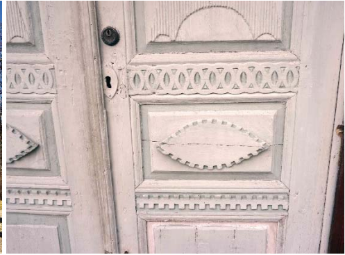
Figur 63. Pardörr med skuren dekor.