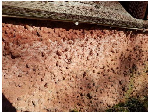
Figur 21. Rosa spritputs på södra sidans sockel.