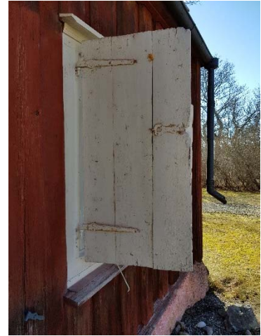
Figur 20. Baksida fönsterlucka, västra fasaden.