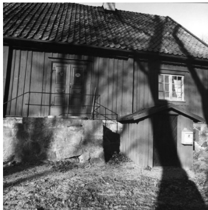
Figur 61. Klockhuset avbildat 1964. Sannolikt är det den mörkare kulör som återfunnits under nuvarande kulör som syns på bilden.