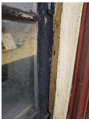
Figur 51. Fönsteromfattningens insida med spår av ockragul.