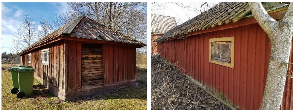
Figur 45. Byggnaden från sydöst.