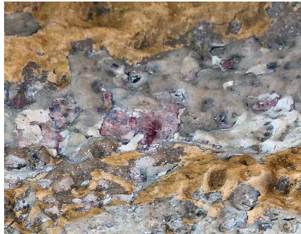
Figur 12. Sockel med underliggande kulörer.