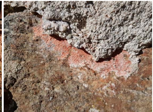
Figur 22. Äldre, slätare puts på östsidan med samma rosa ton.