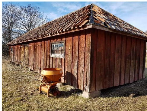
Figur 43. Tegelboden från sydöst.