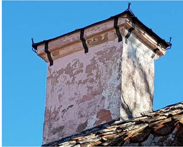
Figur 19. Rosa ton under den vita på skorstenen.