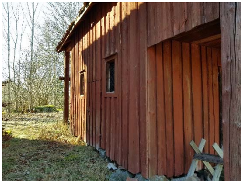
Figur 82. Rödfärgade omfattningar omkring öppningar.