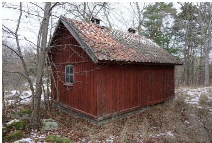
Figur 84. Fönster med vit båge.