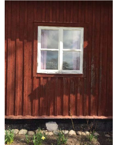
Figur 34. Vitbrutet fönster med röd omfattning.