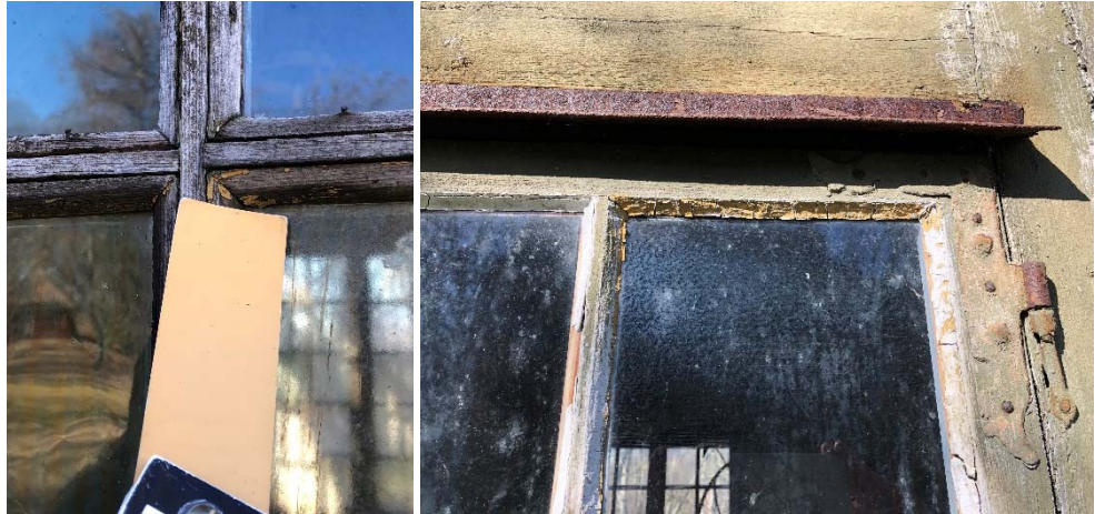
Figur 56. Dörr, spår av ockragul kulör på dörrens spröjs.