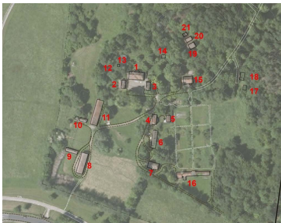
Figur 2. Byggnadsnumrering i KM:s inventering.

För byggnad 11 Ladugård och stall finns uppgifter om att man tidigare haft gula detaljer. Detta undersöks översiktligt. För samtliga övriga byggnader som tidigare har föreslagits få någon form av skydds- eller varsamhetsbestämmelser ges en generell kulör- eller materialangivelse, som ur antikvarisk synvinkel bör användas. Detta kan gälla ytor som bör behandlas med faluröd slamfärg eller tjära exempelvis. En generell riktlinje ges.