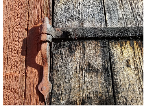
Figur 42. Spår av tjära på port och smide.