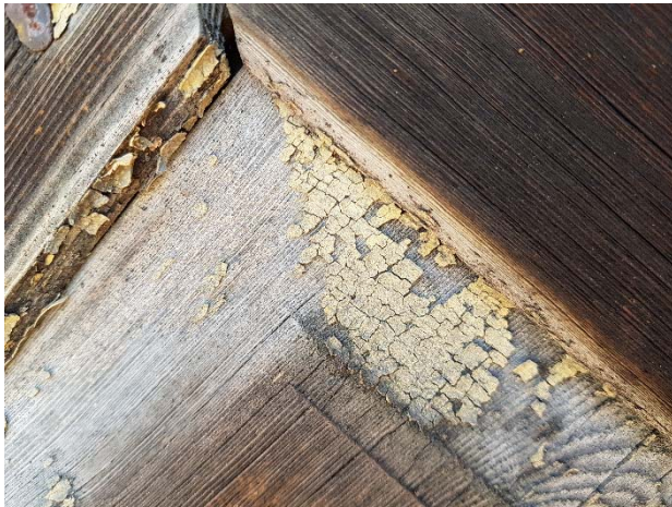
Figur 80. Spår av ockragult pigment på övre dörr i väster.