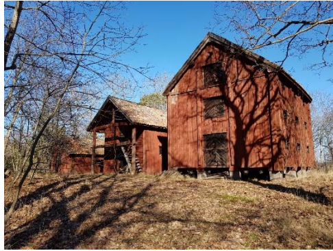
Figur 74. Magasin sett från sydväst.