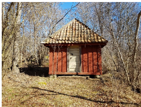
Figur 59. Boden är av sent datum och har inte undersökts närmare vad gäller exakta kulörer.

Boden är av sent datum och har inte undersökts närmare vad gäller exakta kulörer.