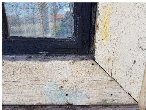
Figur 49. Fönsteromfattning östsida, framskarapad gul kulör.